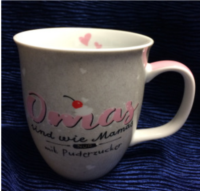
Porzellan-Tasse „Omas sind wie Mama, nur mit Puderzucker“