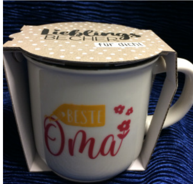
Porzellan-Becher „Beste Oma“